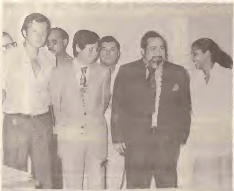
Diputado Leo den presencia di algun specialistanan nobo.

Un otro proyecto cu Gobierno ta trahando ariba dje ta un centro di crisis pa trata enfermedadnan mental.